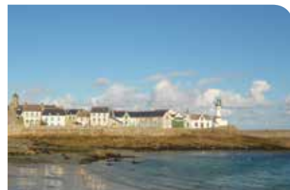
Jeudi 16 juin

Réunie au centre hospitalier de Cancale, la Conférence Régionale de la Santé et de l'Autonomie a ouvert une conférence-débat sur le thème de la chirurgie ambulatoire. L'amélioration de la qualité des soins et du confort des patients, l'innovation organisationnelle et la coordination de tous les acteurs ont alimenté les discussions. La thématique a aussi soulevé quelques questionnements : les patients sont-ils tous, et à quelles conditions, éligibles à ce type de prise en charge ?