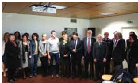
Mercredi 3 février

Les coopérations entre les établissements de santé publics du territoire de santé n°1 (Brest - Morlaix - Carhaix) ont pris un nouvel élan. Réunis à Landerneau, les représentants des centres hospitaliers de Crozon, Landerneau, Lanmeur, Lesneven, Morlaix, Saint-Renan et le centre hospitalier régional universitaire de Brest, tous membres de la communauté hospitalière de territoire Nord-Finistère, ont signé, avec l'ARS Bretagne, un contrat hospitalier de territoire.