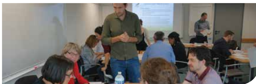
Les partenaires mobilisés dans le cadre de la construction du PRSE 3 se sont déjà réunis à deux reprises pour des journées de travail en ateliers. L'occasion de prioriser les actions.