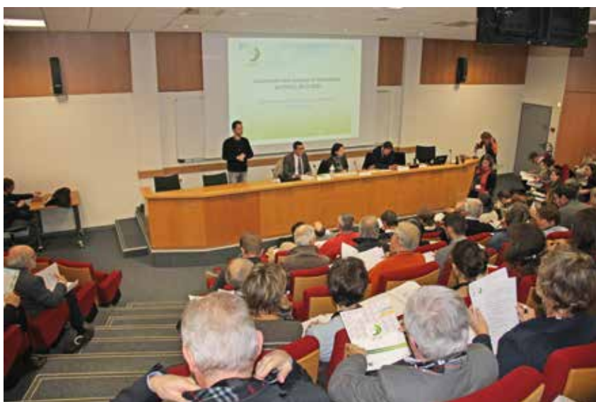
Le coup d'envoi de la construction du plan régional santé environnement a été donné le 22 mars dernier lors de la réunion de lancement.