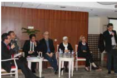
Jeudi 4 février

Les coopérations entre les établissements de santé publics du territoire de santé n°1 (Brest - Morlaix - Carhaix) ont pris un nouvel élan. Réunis à Landerneau, les représentants des centres hospitaliers de Crozon, Landerneau, Lanmeur, Lesneven, Morlaix, Saint-Renan et le centre hospitalier régional universitaire de Brest, tous membres de la communauté hospitalière de territoire Nord-Finistère, ont signé, avec l'ARS Bretagne, un contrat hospitalier de territoire.